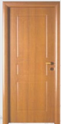
εσωτερικού χώρου P.V.C.