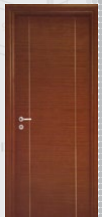
εσωτερικού χώρου laminate