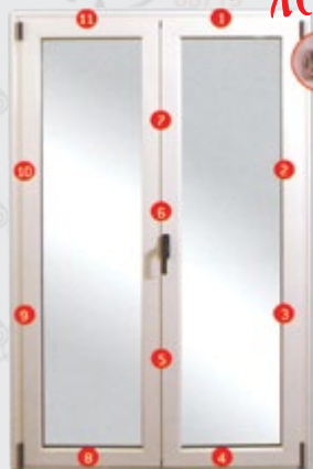
ανοιγόμενη μπαλκονόπορτα αντιδιαρρικτική (wk2-wk3)