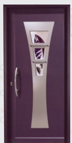
πόρτα εισόδου inox

ποιότητα & τεχνολογία σε ανταγωνιστικές τιμές από 0 έως 48 δόσεις!!