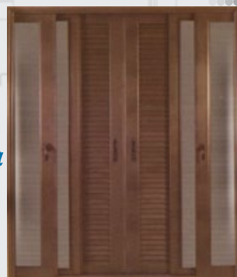
συρόμενη δίφυλλη μπαλκονόπορτα