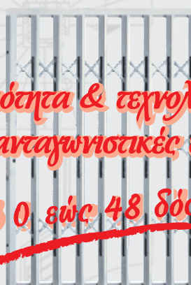
πιτσόμενα κάγκελα ασφαλείας