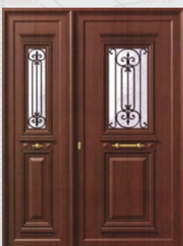
πόρτα εισόδου παραδοσιακή